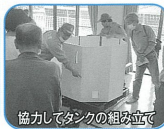
協力してタンクの組み立て