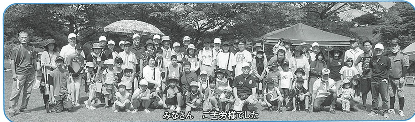
みなさん ご苦労様でした