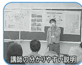
講師の分かりやすい説明

水道水の配水の流れと東日本大震災直後の復旧について講話をいただきました。そして訓練では、講師がタンクの組み立て方・給水の要領・注意事項を説明しながら、タンクの組み立てを実演してくれました。その後、参加者が互いに協力しながら講師の支援を受け、実際に給水タンクを組み立てました。この訓練を通して、大規模災害時における学区内の給水に対する心構えを新たにしました。また、有事の際は、地域住民一人一人の自助と共助が不可欠であることを、再認識しました。なお、給水タンクは、台原中学校に保管し、災害時に使用します。