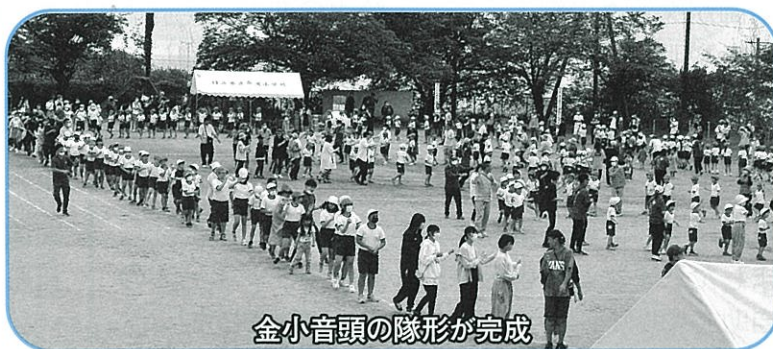
金小音頭の隊形が完成

5月21日(日)に金沢小学校の大運動会が実施されました。晴天にめぐまれ、2年ぶりに地域の人たちも参加しての楽しい運動会となりました。金小音頭では金沢学区コミュニティ推進会の皆さんも事前に練習した成果を発揮し、元気に最後まで踊りました。5年生のソーラン節やWTC(World Tsunahiki Classic)は新しい取り組みでした。また、地域モビリティも活躍しました。一日順延となりましたが、子どもたちと楽しい一日を過ごすことができました。