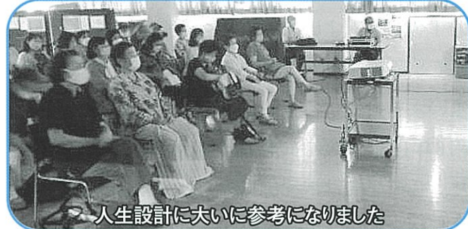
人生設計に大いに参考になりました