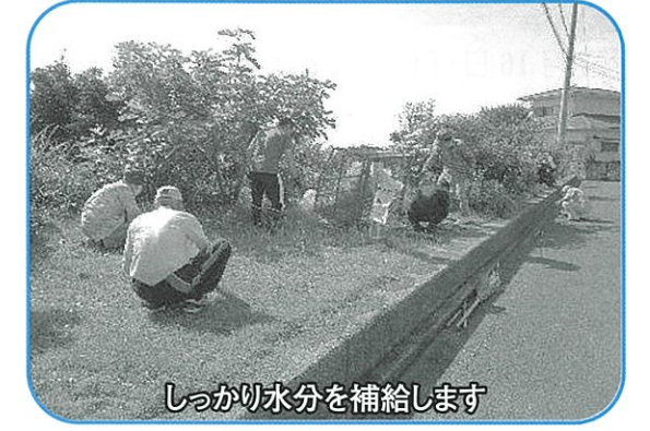
しっかり水分を補給します