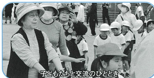
子どもたちと交流のひととき